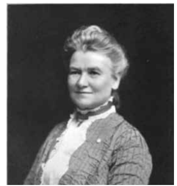
Charlotte Gray.