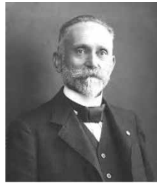
Georg Asmussen.

Und so wurde am 1. November 1891 die Guttemplerloge Berolina gegründet.